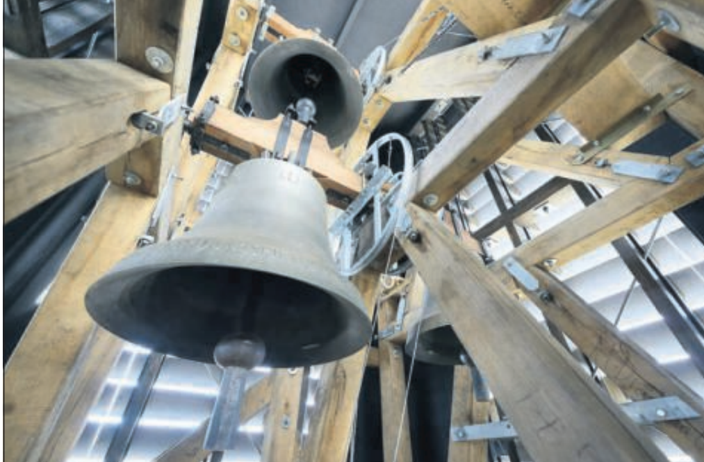
„Im Detail sorgfältig ausgeführt“: Mit dem Bau des Glockenturms, weitgehend aus Spendenmitteln finanziert, wurde laut Jury die Kirche „nach mehr als 50 Jahren harmonisch vollendet“.