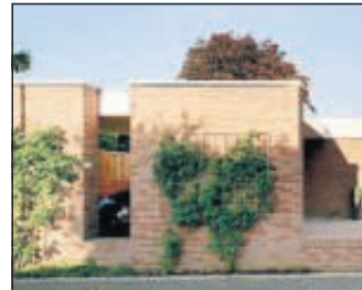
Weitere Einsendung: Carport an der Overmannstraße.