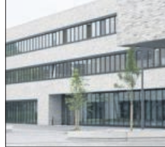
Die Hochschule wurde auch für den Wettbewerb gemeldet.